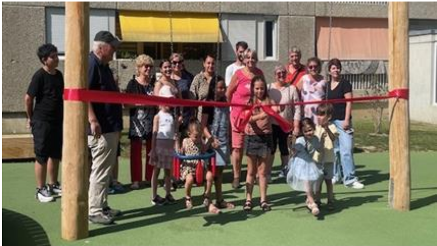
Inauguration du 25 juin coupé de ruban

Débutés en décembre 2024, les travaux de rénovation de la nouvelle place de jeux des Biondes se sont achevés par l'inauguration de celle-ci le 25 juin 2025. Une petite cérémonie avec coupage de ruban et collation a été organisée à cette occasion.